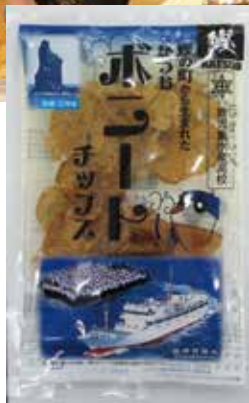
「かつおボニートチップス」